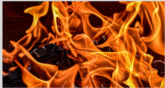
Feuer und Flamme für die Homöopathie

Es ist gar nicht so schwer, egal, wie viel oder wenig Sie schon über Homöopathie wissen: